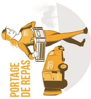
PORTAGE DE REPAS