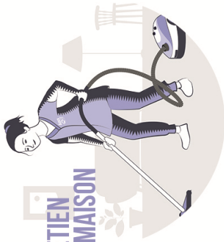
ENTRETIEN DE LA MAISON